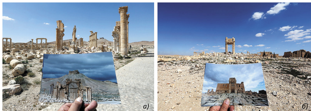
Рис. 1 – Разрушенные памятники древней Пальмиры (Сирия). Триумфальная Арка (а) и Храм Баала (б)

церковь святого Георгия. Розыском преступников и их добычи уже занялся Интерпол при содействии ЮНЕСКО.